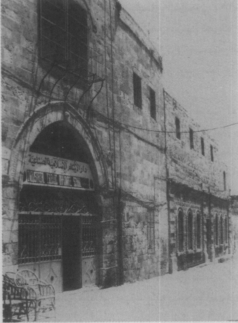
العمارة العامرة (خاصكي سلطان). الواجهة الجنوبية للمجمع بمحاذاة عقبة السرايا.